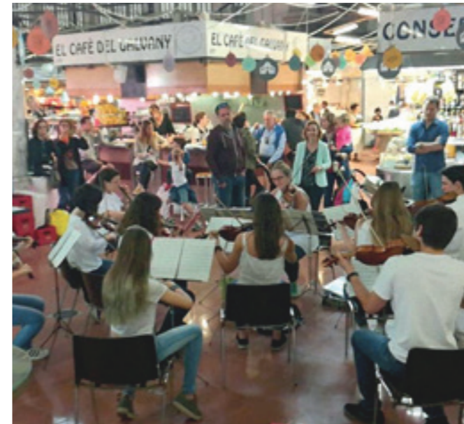
Concert al Mercat Galvany

Les imatges següents són una mostra d'aquestes activitats.