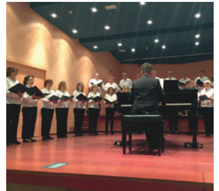
El Cor del CIC