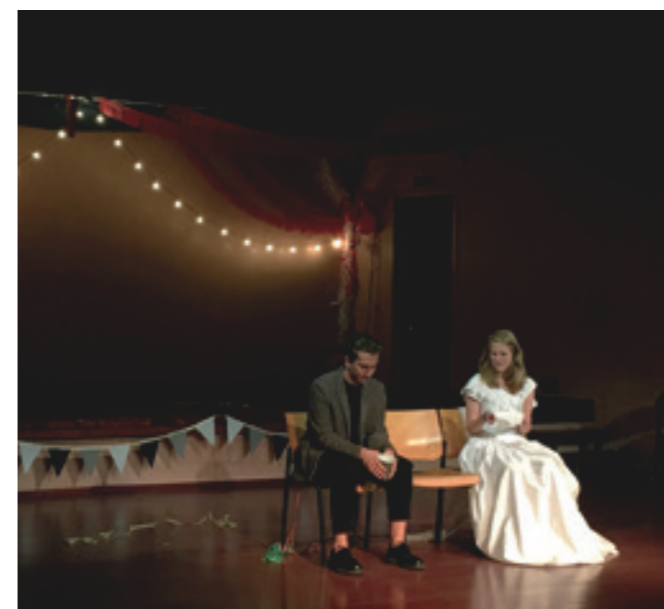
El grup de teatre de Batxillerat