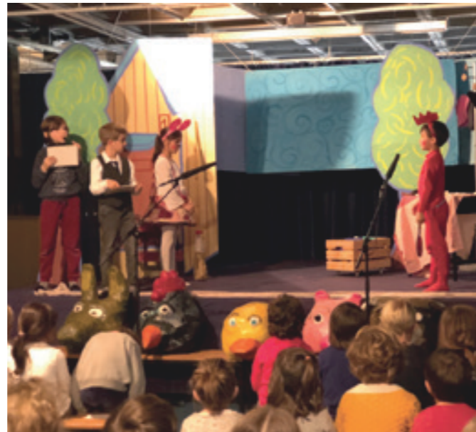
Fem teatre pels companys de l'escola