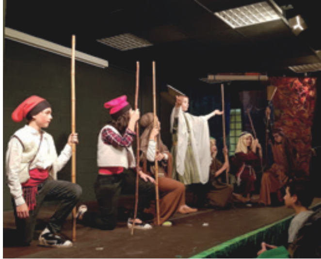
El Pessebre vivent i els Pastorets a les escoles Thau

Celebració de Nadal 2019, amb música i teatre, a les escoles de la ICCIC