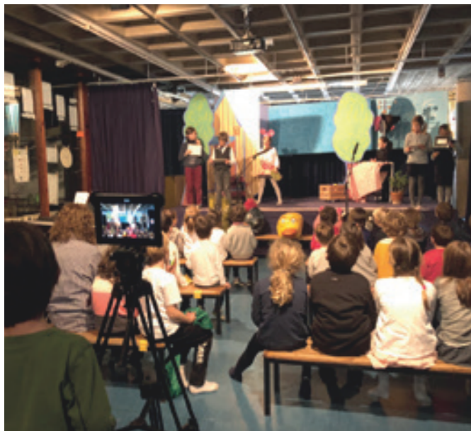
Fem teatre pels companys de l'escola