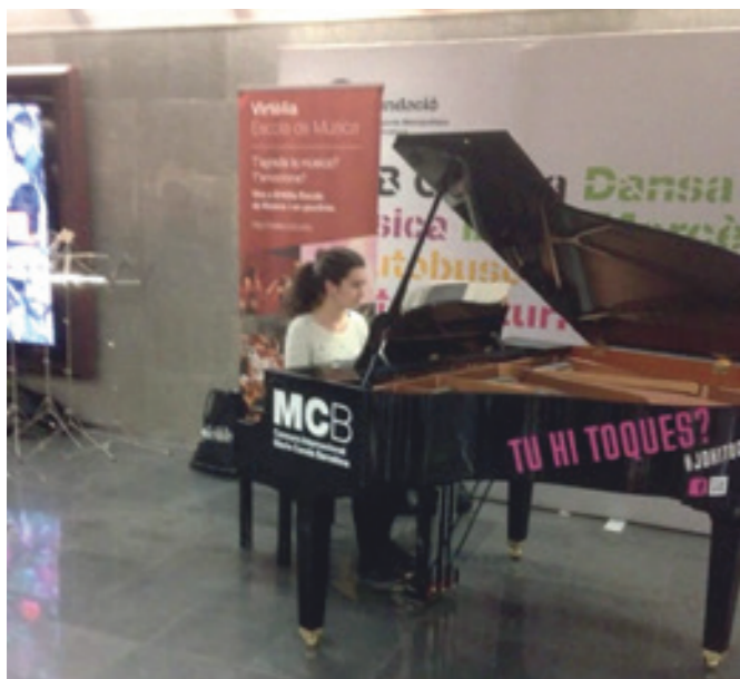
Participació al concurs internacional de piano Maria Canals