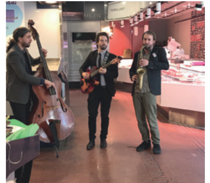
Concert al Mercat Galvany