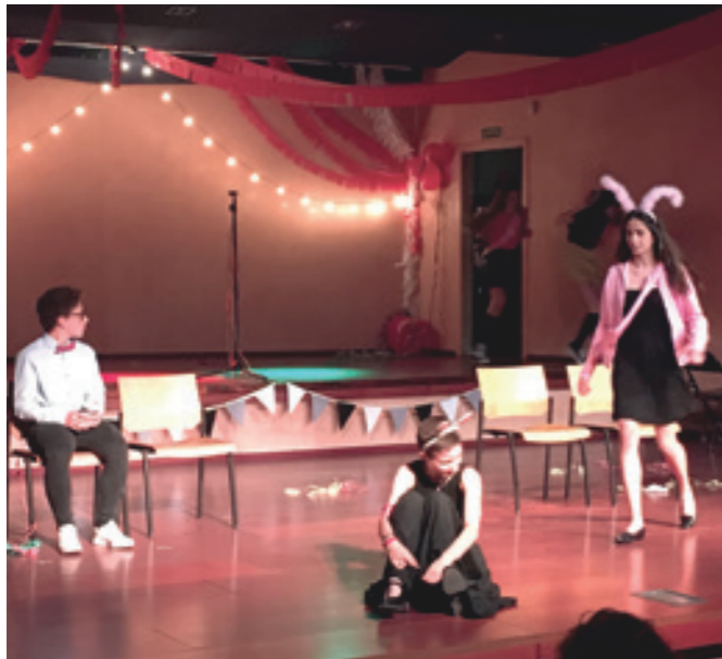
Fem teatre pels companys de l'escola