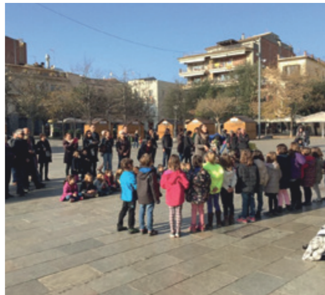
La coral infantil actuant al carrer