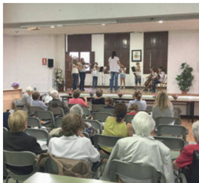
Concert a la LLar d'avis Mossèn Lluís Vidala