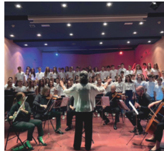
Concert d'una cantata d'alumnat 1r ESO al CIC