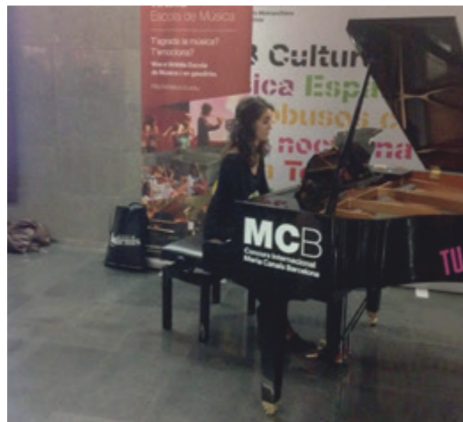
Participació al concurs internacional de piano Maria Canals