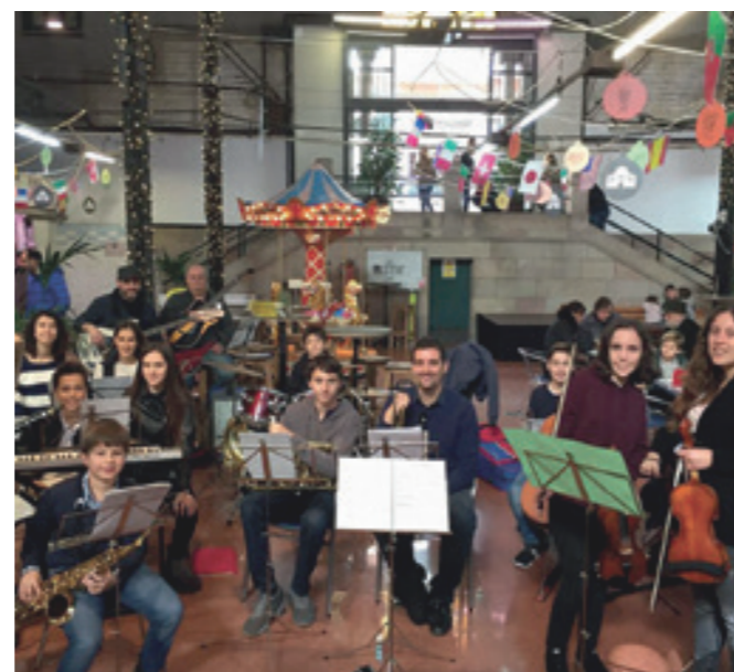
Concert al Mercat Galvany