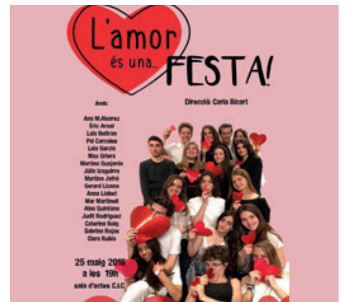
El grup de teatre de Batxillerat