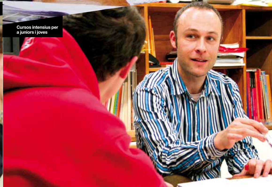
Cursos intensius per a juniors i joves