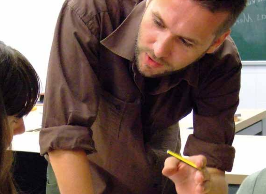
Cursos per a joves i adults