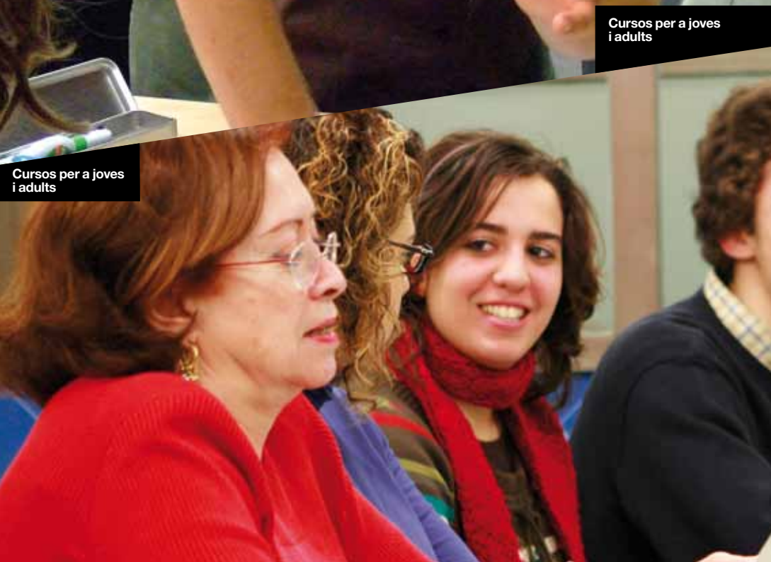
Cursos per a joves i adults