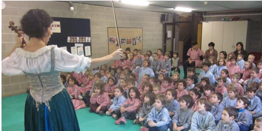
Santa Cecilia con niños