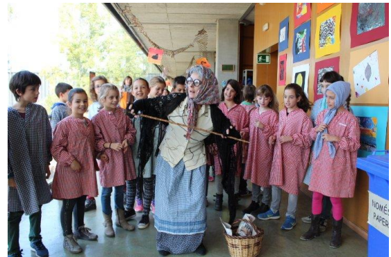
La castañera con los niños