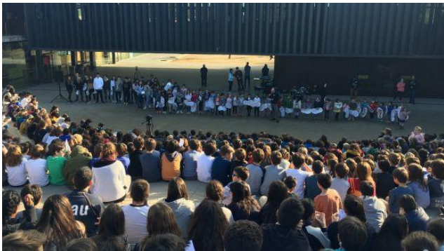
San Jordi 2017